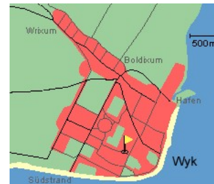
Entfernungen, zirka: zum Bäcker 300 m, zur Einkaufsmöglichkeit 500 m, zum Flugplatz 1,0 km, zum Golfplatz 1,5 km, zum Hafen 1,5 km, zum Meer 600 m, zum Badestrand 600 m, zum Ortszentrum 1,0 km