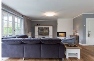
Hygge - den Moment zu genießen.