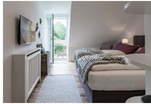
Eine frische Brise weht ins Schlafzimmer