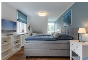
Der blaue Raum - hier ist Entspannung pur angesagt