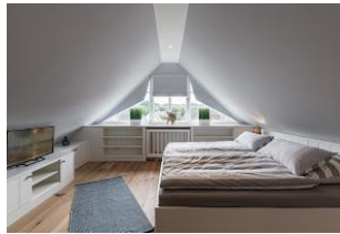
Der große Schlafrum läßt keine Wünsche offen