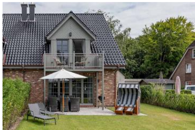
Rückansicht vom Haus Hygge

Die Unterkunft verteilt sich über EG, 1.OG und 2.OG.