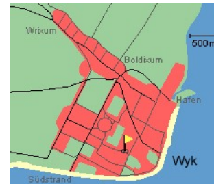
Entfernungen, zirka: zum Bäcker 300 m, zur Einkaufsmöglichkeit 500 m, zum Flugplatz 1,0 km, zum Golfplatz 1,5 km, zum Hafen 1,5 km, zum Meer 600 m, zum Badestrand 600 m, zum Ortszentrum 1,0 km