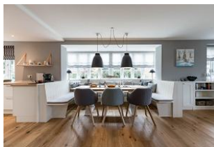
Der große moderne Essbereich in der Utlucht lädt jeden Tag zu einem ausgiebigen Frühstück ein.