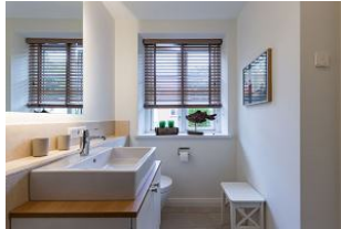
Das Bad im Erdgeschoss