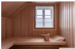
Die eigene Sauna - perfekt für einen Wellnessstag