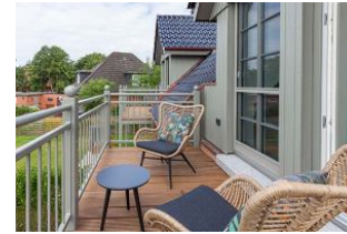
Den ersten Kaffee am Morgen gleich auf dem Balkon genießen.