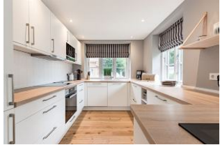
Die Küche für jeden Meisterkoch perfekt