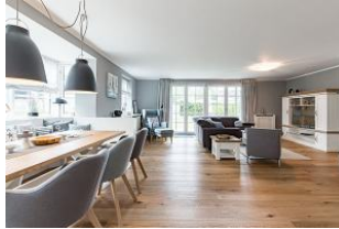
Die Farbwahl im Haus ist perfekt auch in den Details wiedergegeben