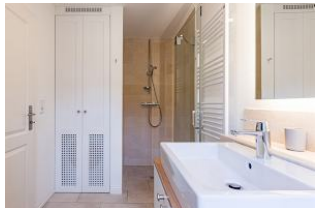
mit begehbaren und bodenebenen Dusche