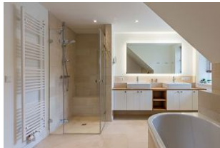
Das große Bad im Obergeschoss mit Wanne und Dusche