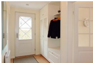
Der einladend große Flur mit integrierter Garderobe.