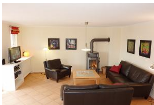
Kaminräume auf Föhr.