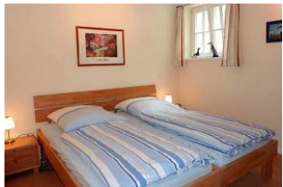
Ein großes Doppelschlafzimmer. Viel Platz für zwei.