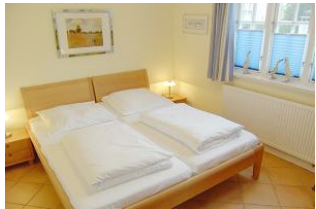
Zeit zum kuscheln im Doppelbettschlafräum im Erdgeschoss.