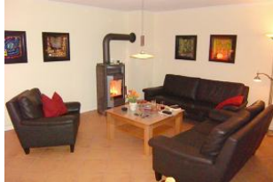
Gemütliches Wohnzimmer mit viel Platz.