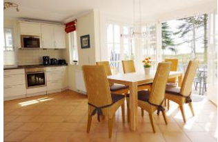
Ein toller Platz für die ganze Familie.