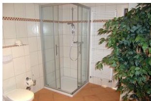
Ein zweites Duschbad im Untergeschoss, neben der Sauna.