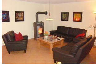
Gemütliches Wohnzimmer mit viel Platz.