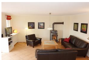
Kaminräume auf Föhr.