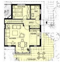
Grundriss : Wohnung Sandburg 1, Erdgeschoss mit Gartenanteil zur alleinigen Nutzung.