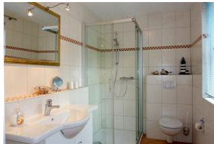
Großes Duschbad im Erdgeschoss.