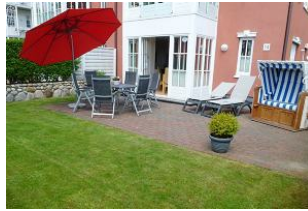
Urlaub privat - Entspannung auf der Terrasse