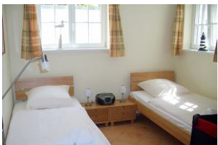
Nichts stört Ihren erholsamen Schlaf.