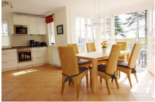
Ein toller Platz für die ganze Familie.