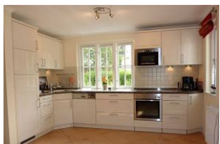
Großzügige Küche mit Granitarbeitsplatte.