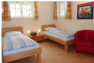
Helles Schlafzimmer mit Fernseher und Zugang zur Wärmekabine.