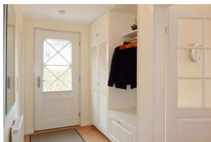
Der einladend große Flur mit integrierter Garderobe.