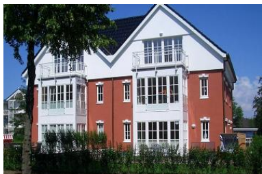
Wohnen am Südstrand von Wyk in Erdgeschoss mit Terrasse und Garten.

Die Unterkunft verteilt sich über EG und UG.